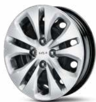
Стальные 15" диски Comfort, Comfort Prize