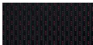
Тканевая отделка Style