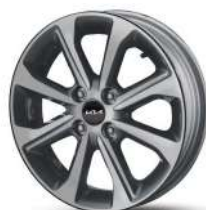
Темные легкосплавные 15" диски Style