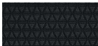
Грязеотталкивающая тканевая отделка Prestige