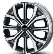
Легкосплавные 16" диски Premium