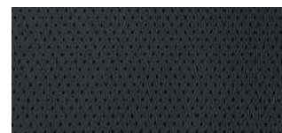
Кожаная отделка Premium