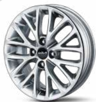
Легкосплавные 15" диски Prestige