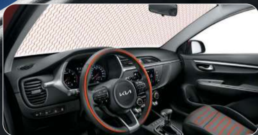
Подогрев лобового стекла, подогрев форсунок