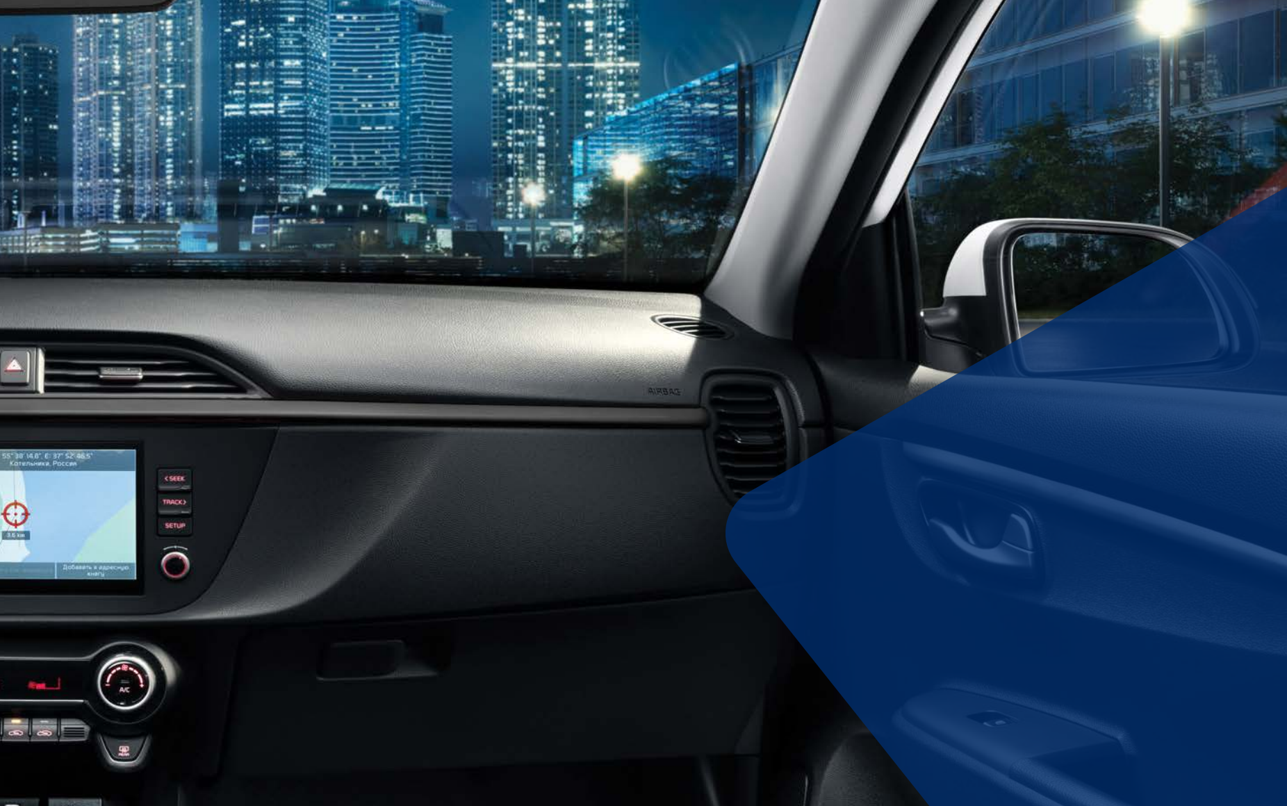
Кондиционер с автоматическим климат-контролем