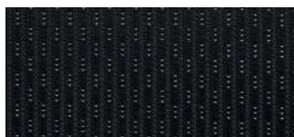
Тканевая отделка Comfort, Comfort Prize